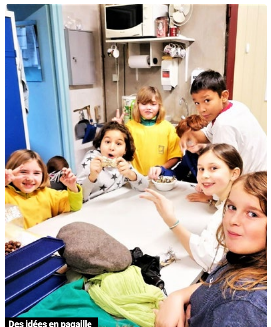
Des idées en pagaille