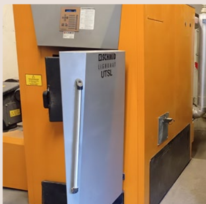
Chaudière à plaquettes forestières à Etueffont

C es visites s'inscrivent dans le cadre de l'audit énergétique des bâtiments communaux initié en 2022. L'objectif était de découvrir des modes de chauffage alternatif qui n'utilisent pas les énergies fossiles, ceci afin d'anticiper les travaux de rénovations énergétiques qui seront à envisager dans les années futures. Cette demi-journée a été riche en échanges avec les différents partenaires et élus locaux.