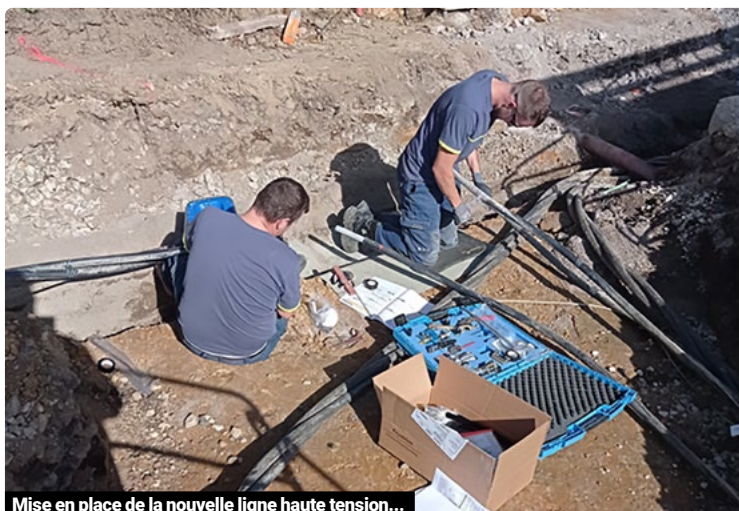
Mise en place de la nouvelle ligne haute tension...