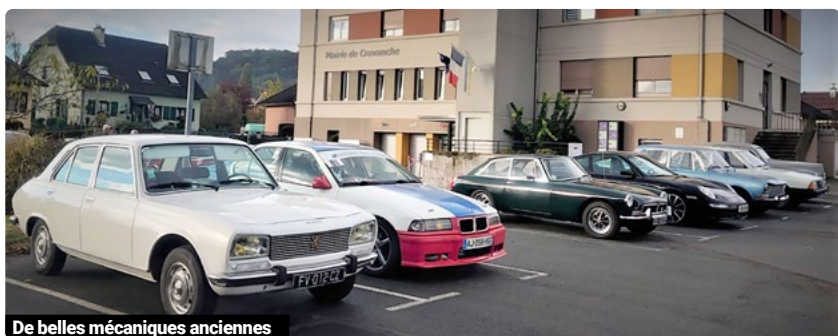
De belles mécaniques anciennes

Association de 60 membres passionnés, le club Belfort Auto Rétro est à l'origine de nombreuses manifestations liées à l'automobile ancienne, motos et mobylettes. Un parc de véhicules variés permet ainsi à un public nostalgique de se replonger dans un passé automobile récent ou ancien lors d'expositions.