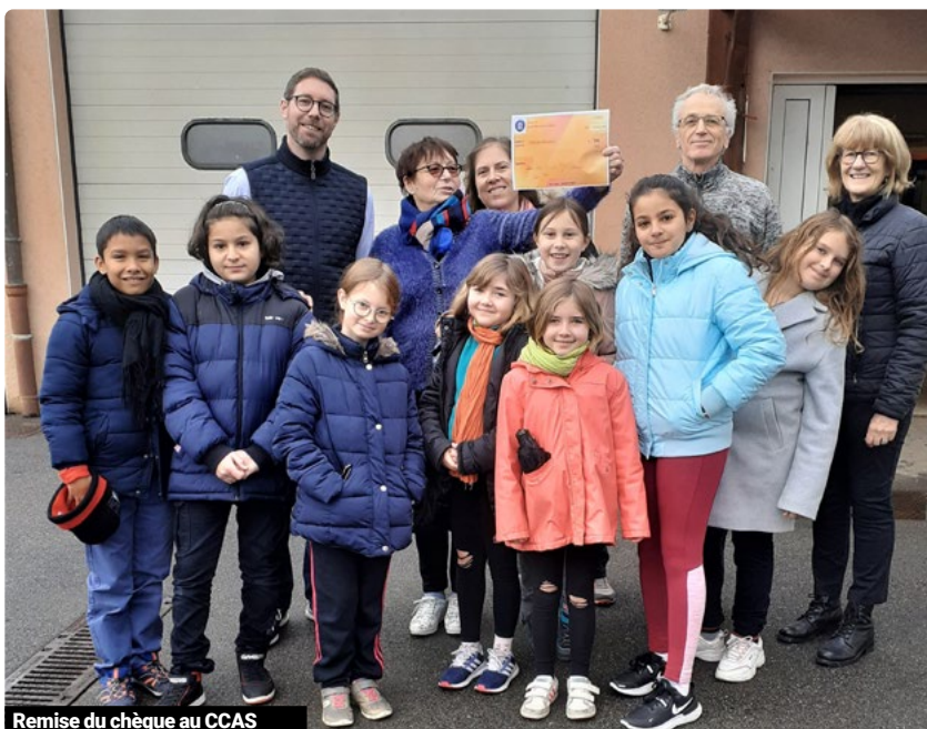
Remise du chèque au CCAS