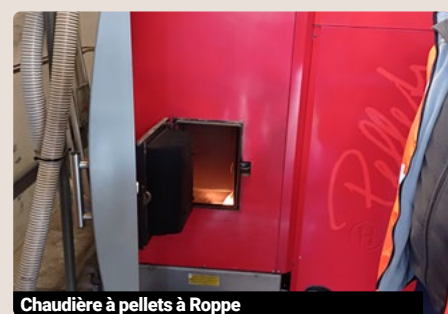
Chaudière à pellets à Roppe