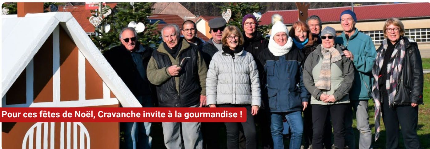
Pour ces fêtes de Noël, Cravanche invite à la gourmandise !

D ès le mois de septembre, deux fois par semaine, l'équipe des « Ateliers » a découpé différents matériaux pour créer une grande maison, des manalas, des cœurs à suspendre (plus de 200 pièces) ; d'anciens décors ont également été remis en état.