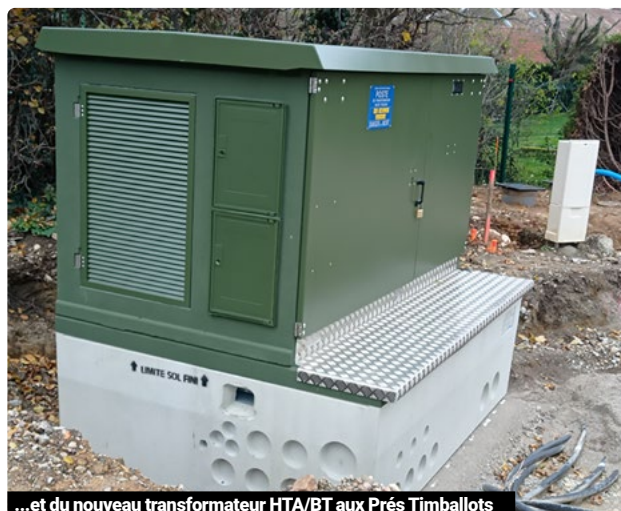
...et du nouveau transformateur HTA/BT aux Prés Timballots