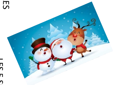
LES 5 SENS