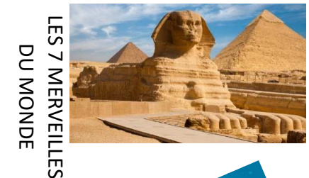
LES 7 MERVEILLES DU MONDE